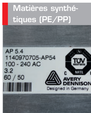
Matières synthétiques (PE/PP)